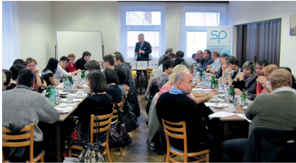
Seminář Problematika DPH ve vztahu k zahraničí

Projekt Udržitelnost sociálního dialogu je realizován v rámci OP LZZ pod záštitou Svazu průmyslu a dopravy ČR (SP) začal v roce 2010 a potrvá do května 2013. Jeho cílem je kromě zkvalitnění sociálního dialogu mezi zaměstnanci a zaměstnavateli, také rozšíření znalostí, profesních kompetencí a schopností zaměstnanců a zaměstnavatelů a rozvíjení systému dalšího vzdělávání formou vzdělávacích