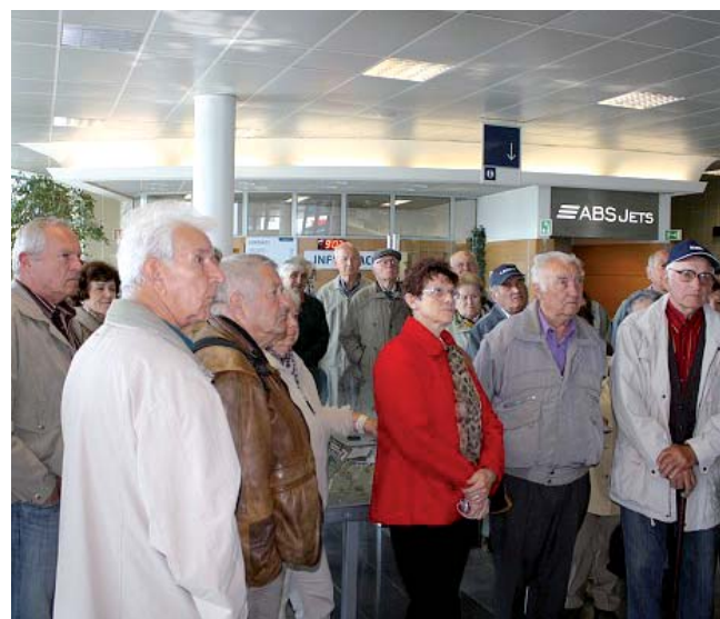
Při návštěvě pražského letiště Ruzyně

Senior klub ZVVZ má kolem 400 členů a svá setkání pořádá už jedenáct let. Jeho činnost se zaměřuje na vzdělávání, kulturně poznávací zájezdy, rekreaci a společenské akce. O činnosti Senior klubu ZVVZ se lze rovněž dozvědět v městském Zpravodaji, ve vývěškách a na webu www.skzvvz.pisecko.info