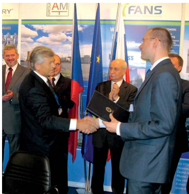
... a s generálním ředitelem Sergejem Kirijenkem při výměně dokumentů

kém průmyslu,“ řekl šéf Rosatomu Sergej Kirijenko. Ten předpokládá, že 70 procent hodnoty zakázky v rámci případné do- stavby JE Temelín by zajišťovala české firmy. To by znamenalo zhruba 4 až 5 miliard eur a práci pro 10 až 20 tisíc lidí.