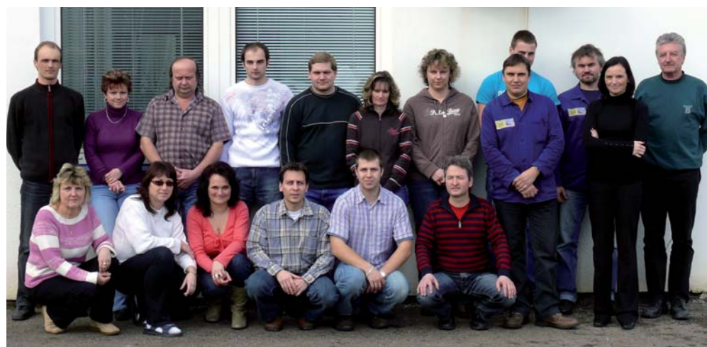
Tým zaměstnanců Profitcentra Megtec

Záliby teď nejsou vůbec podstatné a musely jít zákonitě stranou. Skloubit práci a rodinu je dnes jednoznačnou prioritou.