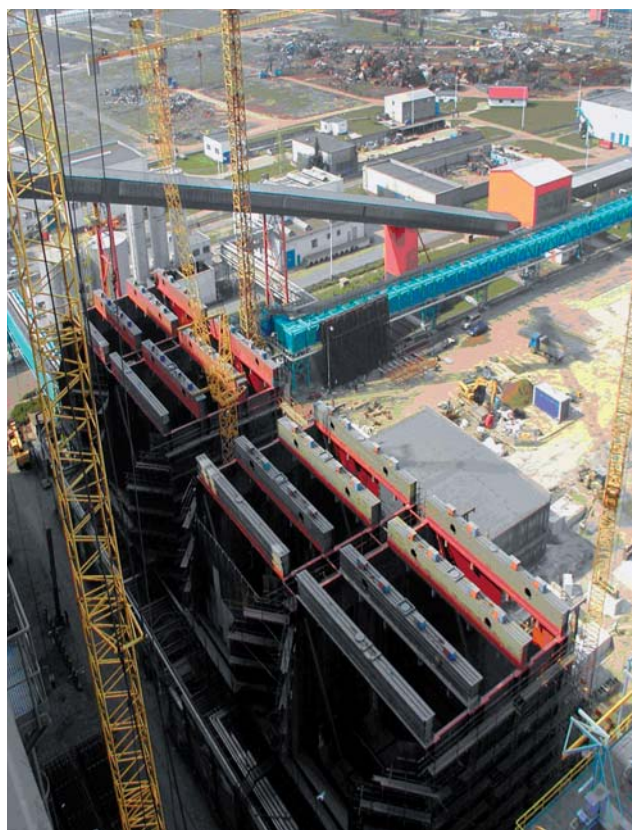
Rozpracovanost stavební části v Ledvicích 03/2010

Odlučovací zařízení německé firmy doplňujeme o projektční zpracování, vlastní dodávky a montáž potrubí, nosných konstrukcí, ventilátorů RSB, kompresorové stanice a tlumičů hluku. Instalováno bude odlučovací zařízení druhého stupně spékacího pasu umístěné za elektrickými odlučovacími a zajišťujícími dočištění spalin. Druhý stupeň čištění zajistí snížení úletu tuhých znečišťujících látek, SO 2 , dioxinů a furanů, a proto jsou do proudu