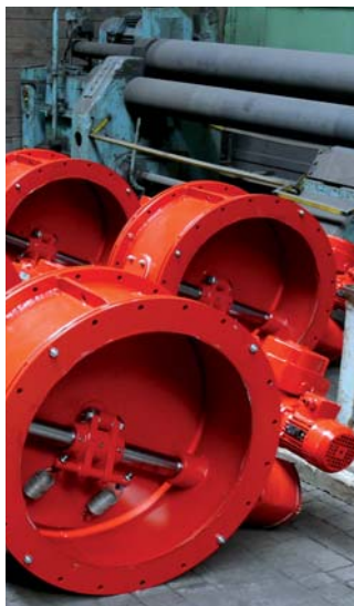
Přetlakové a hermetické klapky pro jadernou energetiku.

Divize Výroba se nyní podílí na zakázkách pro dostavbu slovenské Jaderné elektrárny Mochovce. Jedná se o herme-